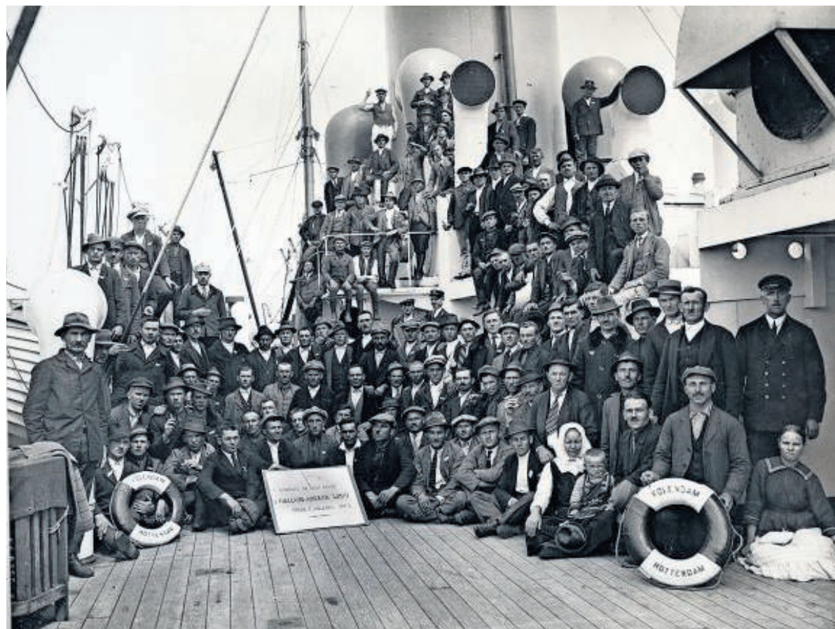
Passagiers aan boord van ss Volendam van de Holland-Amerika Lijn, circa 1925.

Vrijwilligers helpen via website VeleHanden.nl sinds eind vorige maand mee het archief online te brengen, betaald door crowdsourcing. Zij krijgen thuis achter de computer een scan van een passagierslijst te zien en vullen vervolgens de gegevens in op een formulier. Naam, datum van vertrek, dat soort gegevens. Zo kan in de toekomst het in-